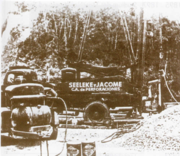
Fuhrpark der Firma „Seeleke & Jacome“ um 1950

01.11.2002 Das Mittweidaer Hochschulgebäude Haus 6 erhält den Namen „Grunert-de-Jácome-Bau“.